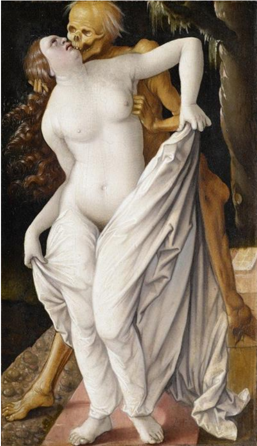
Kuva 11. Hans Baldung: Kuolema ja neito , noin 1520, 29,8 x 17,1 cm.