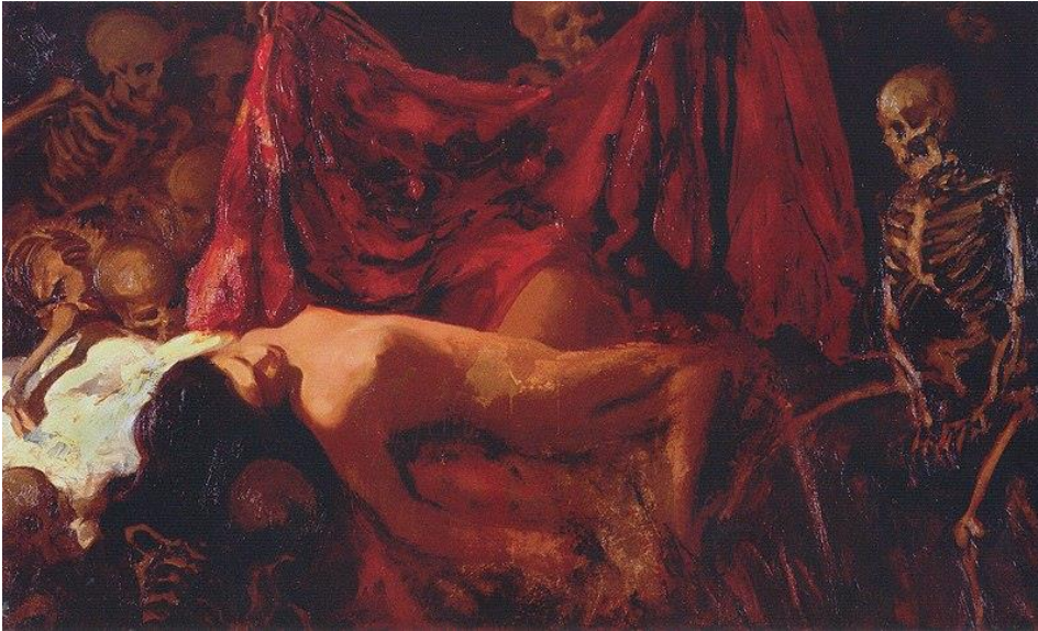
Kuva 3. Oscar Parviainen: Loppu , öljy kankaalle, 1910, 90 x 150 cm.