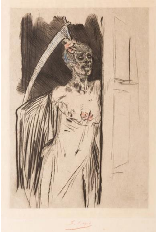
Kuva 7. Félicien Rops: Mors Syphilitica , etsaus, 1905, 22,1 × 16 cm.

Kuvalähde: [ https://rops.digitalscholarship.emory.edu/items/show/107. ]