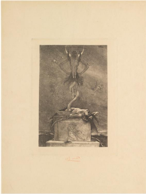
Kuva 9. Félicien Rops: Uhraus , etsaus, 1882, 45,5 x 34,4 cm.