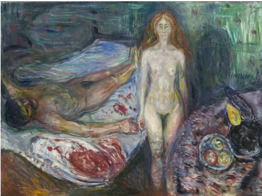
Kuva 2. Edvard Munch: Marat'n kuolema I , öljy kankaalle, 1907, 150 x 200 cm.