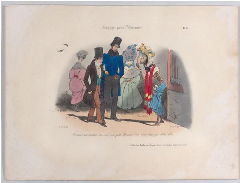
Kuva 15. J. J. Grandville: Ikuinen matka , noin 1839, 25,5 x 34,2 cm.