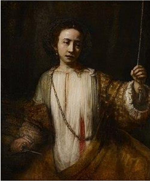
Kuva 22. Rembrandt: Lucretia , 1666, öljyväri kankaalle, 110,2 x 92,3 cm.