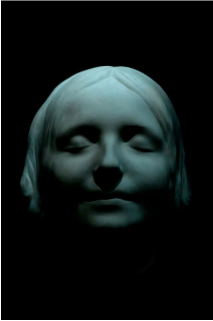
Kuva 13. Seinen tuntematon , valokuva.