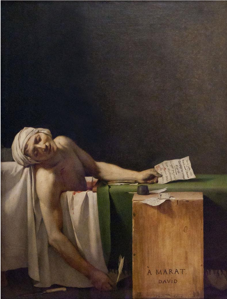
Kuva 19. Jacques-Louis David: Marat'n kuolema , 1793, 1,62 x 1,28 m.