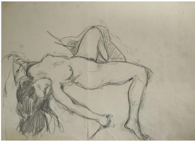
Kuva 21. Oscar Parviainen: Loppu , lyijykynä paperille, 1910.