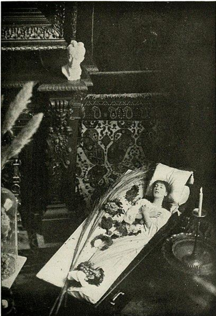
Kuva 4. Sarah Bernhardt/Achille Méléndri: "Arkku", valokuva, 1873.