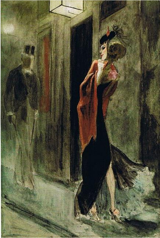
Kuva 1. Felicien Rops: Ihmispardia , vesiväri ja pastelliilitu, 1878–1881, 22,5 x 15 cm.