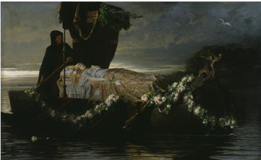
Kuva 23. Toby Rosenhalt: Elaine , öljyväri kankaalle, 1874, 97,9 x 158,8 cm.