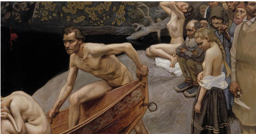
Kuva 6. Akseli Gallen-Kallela: Tuonelan joella , tempera kankaalle, 1903, 77 x 145 cm.