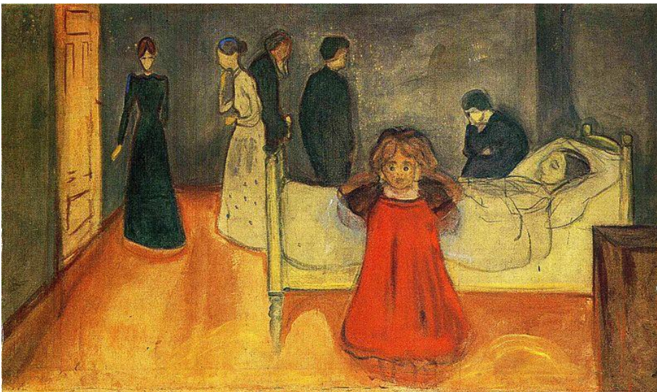
Kuva 18. Edvard Munch: Kuollut äiti ja lapsi , 1897–99, 104,5 x 179,5 cm.