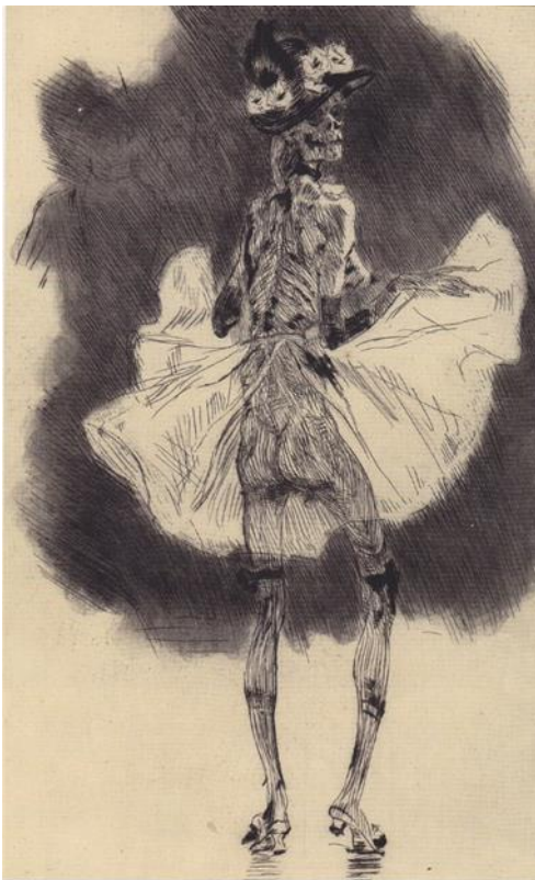
Kuva 16. Kuva: Félicien Rops: Tanssiva kuolema , noin 1865, 55 x 37 cm.