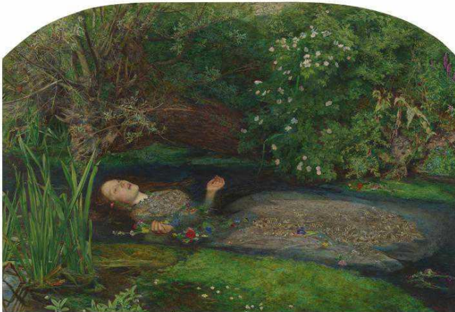
Kuva 14. John Everett Millais: Ofelia , öljyväri kankaalle, 1851–52, 76,2 x 1,118 cm.