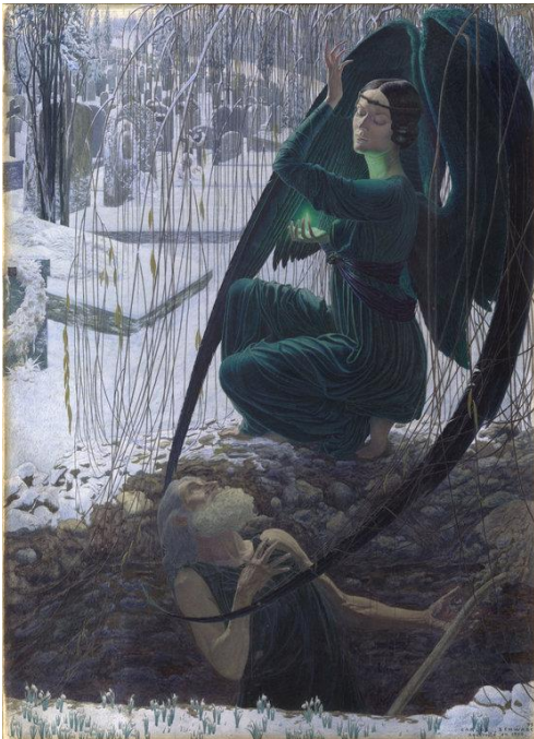
Kuva 10. Carlos Schwabe: Kuolema ja haudankaivaja (La mort du fossoyeur) , 1895–1900, akvarelli, 76 x 56 cm.