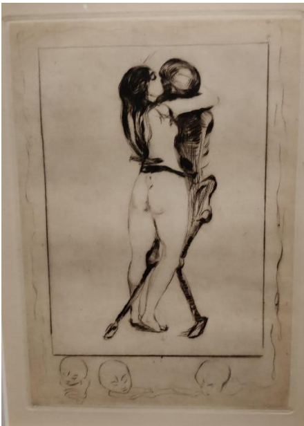
Kuva 12. Edvard Munch: Kuolema ja neito , 1894, 23 x 16 cm.