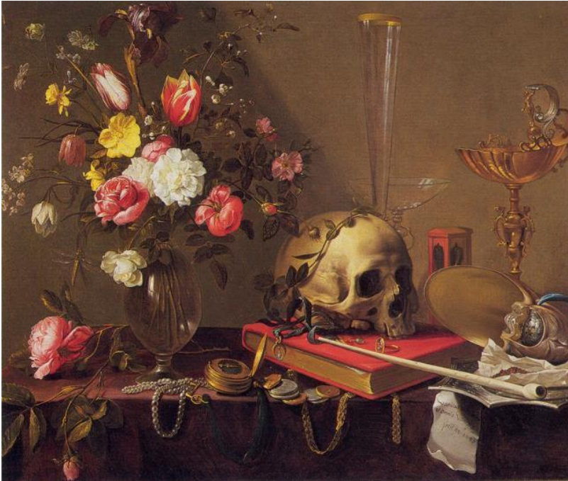
Kuva 5. Adriaen van Utrecht: Vanitas-asetelma kukkakimpun ja pääkallon kanssa , öljyväri kankaalle, 1643, 67,3 x 86,4 cm.