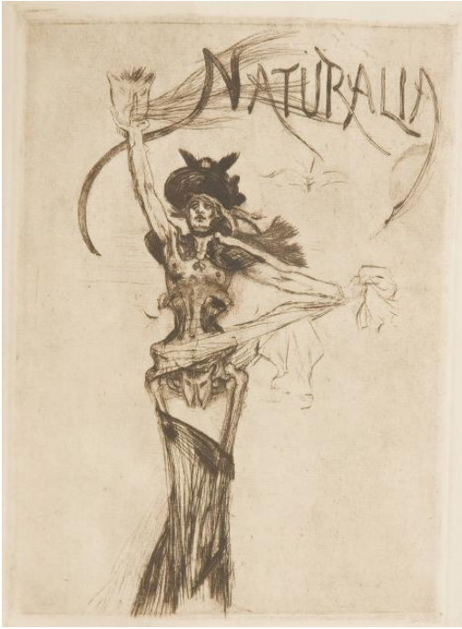
Kuva 17. Félicien Rops: Naturalia , piirros paperille, noin 1875, 19 x 13,8 cm.