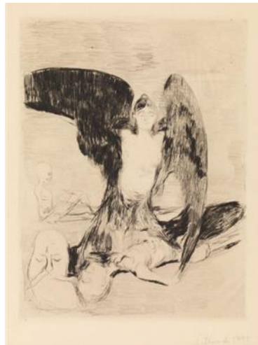
Kuva 8. Edvard Munch: Harpyja , grafiikan vedos, 1894, 28,9 × 21, 8 cm.